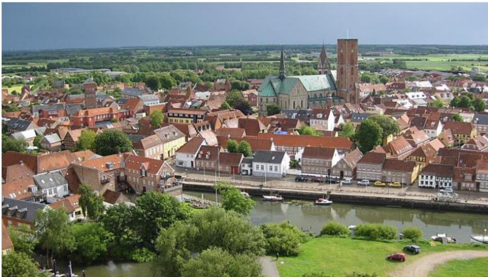
Ribe set fra oven

Ribe er kåret til Europas smukkeste lille by af en engelsk rejsehjemmeside i samarbejde med en tysk hotelside.